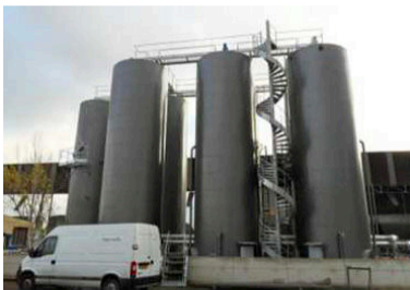
PARC À LIANT