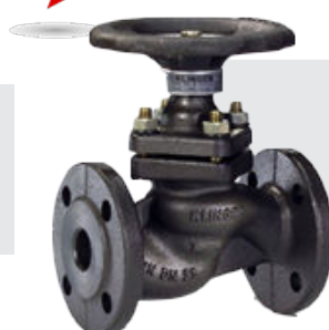
Robinet Piston Fonte-Acier-Inox Taraudé à bride Dn15 au Dn200 PN16-PN40