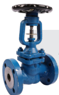
Robinet BSA Robinet Soupape Soufflet Dn15 au Dn200 PN16-PN40