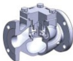
Clapet à bride LCV