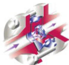
Clapet entre bride DCV