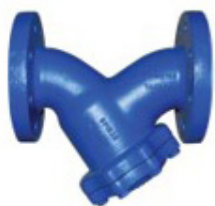
Filtre Fonte PN16 / Acier PN40